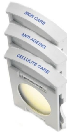
Q.Light® SKIN CARE Module