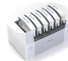
Q.Light® Colour Filter Set