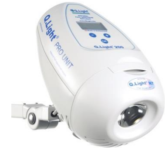
Q.Light® PRO UNIT