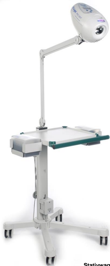
Stativwagen PRO (Beispiel mit Q.Light ® PRO UNIT)