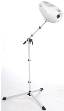
Stativ HOME (Beispiel mit Q.Light® SKIN CARE UNIT)