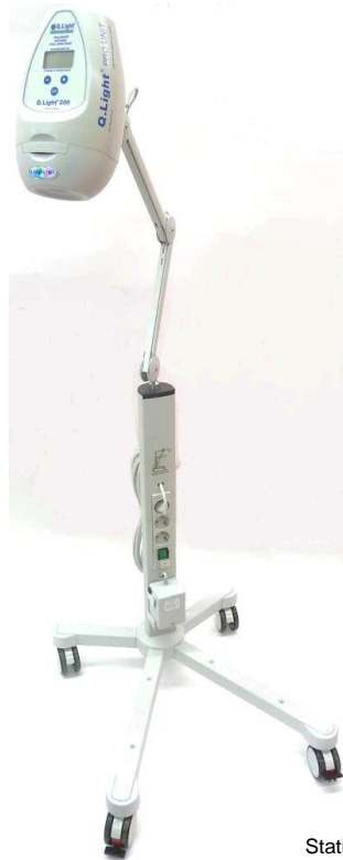
Stativwagen STANDARD (Beispiel mit Q.Light ® PRO UNIT)