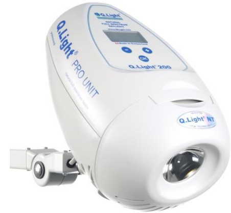
Q.Light® PRO UNIT