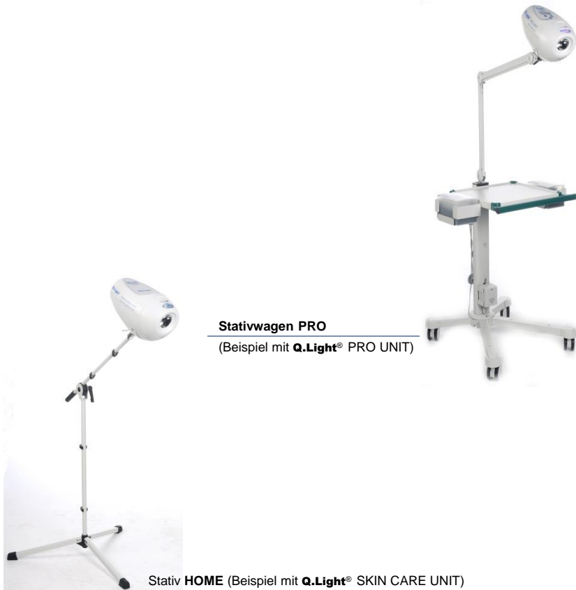
Stativwagen PRO (Beispiel mit Q.Light® PRO UNIT )