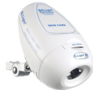
Q.Light® SKIN CARE UNIT