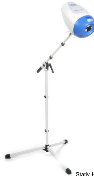
Stativ HOME (Beispiel mit Q.Light ® ACNE CARE)