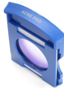
Q.Light® ACNE CARE Modul