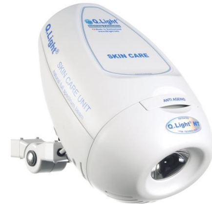
Q.Light® SKIN CARE UNIT