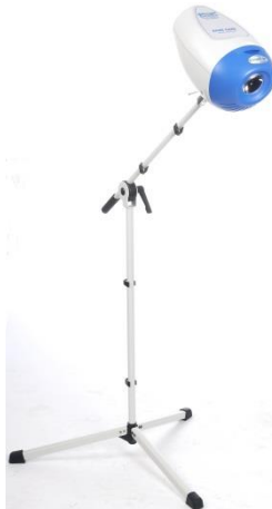
Stativ HOME (Beispiel mit Q.Light® ACNE CARE)