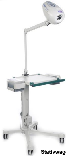
Stativwagen PRO (Beispiel mit Q.Light® PRO UNIT)