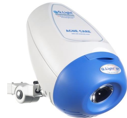
Q.Light® ACNE CARE