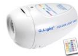
Q.Light® COLOUR LIGHT UNIT mit Fernbedienung