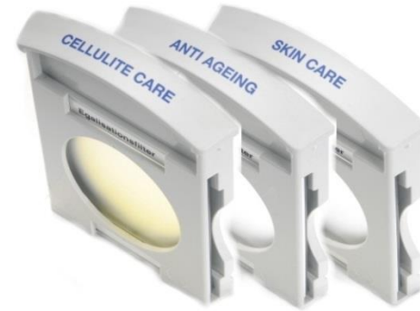
Q.Light® Cosmetic Filter Set